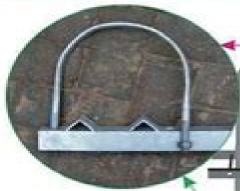
Galvanized metal hoop